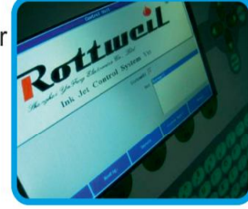
LINUX işletim sistemi