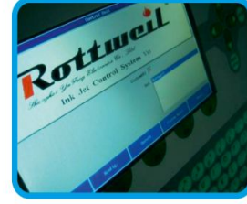
LINUX işletim sistemi